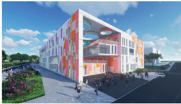
למעלה: מבט מצפון-מזרח במרכז: מבט ממזרח למטה: חזית כניסה ראשית

"המתחם הפדגוגי" החדשני מחבר ומרכיב מחדש את הפרוגרמות הסדורות – בפרשנויות, בכיוונים, ובקווים תוך הקפדה על אפשרות חזרה – שינוי – התאמה ועוד.