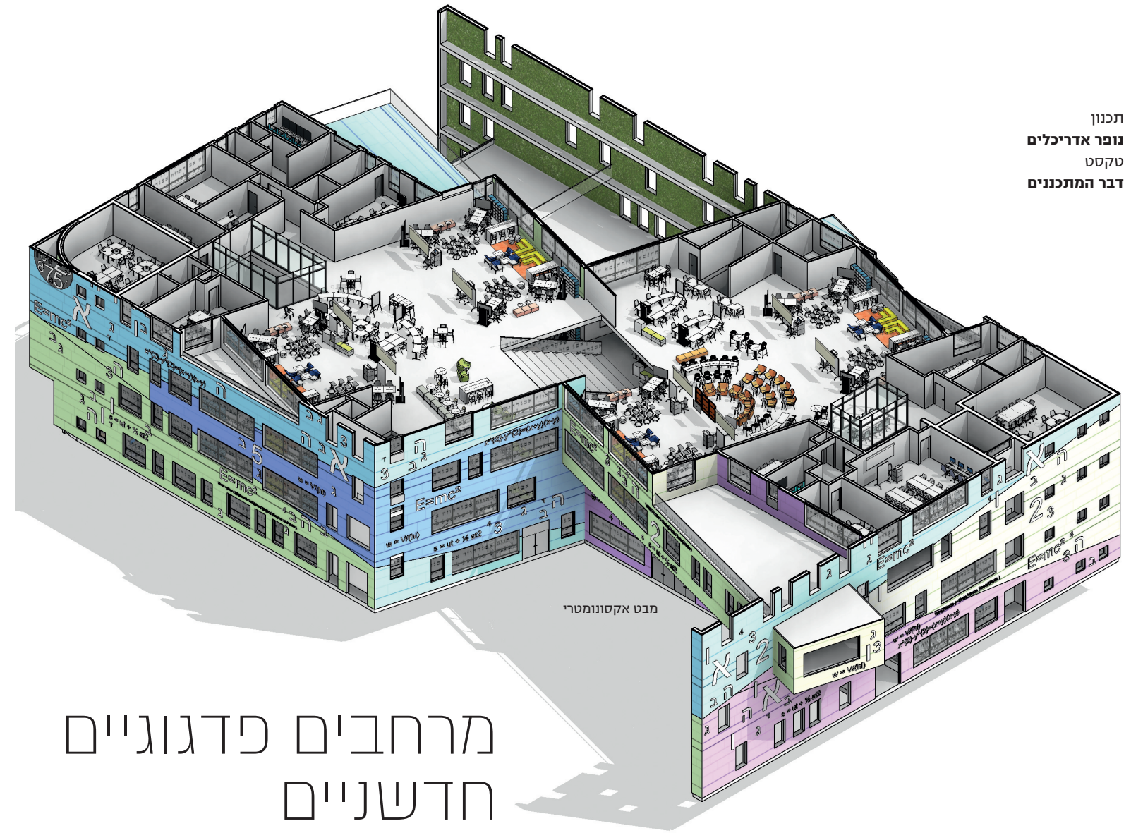
תכנון נובר אדריכלים טקסט דבר המתכננים