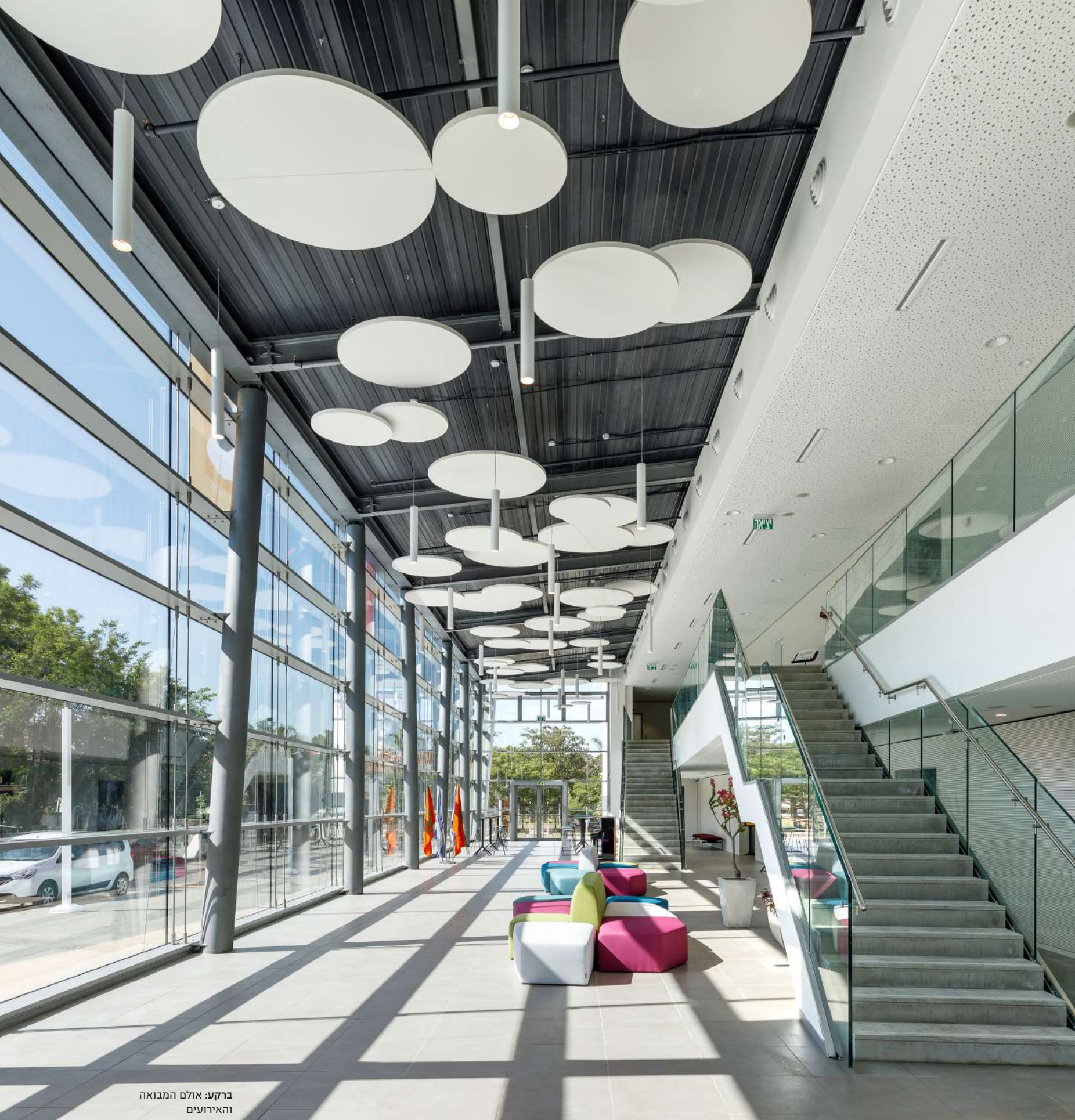
ברקע: אולם המבואה והאירועים