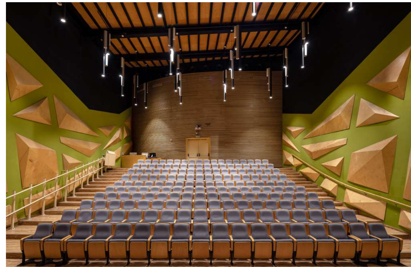
למעלה – מימין: בר מוסיקלי משמאל: חדר הרכבים במרכז: אודיטוריום ממול – למעלה: מבט על ממערב במרכז: מבט מדרום; מבט על למטה: הכניסה והחזית הראשית