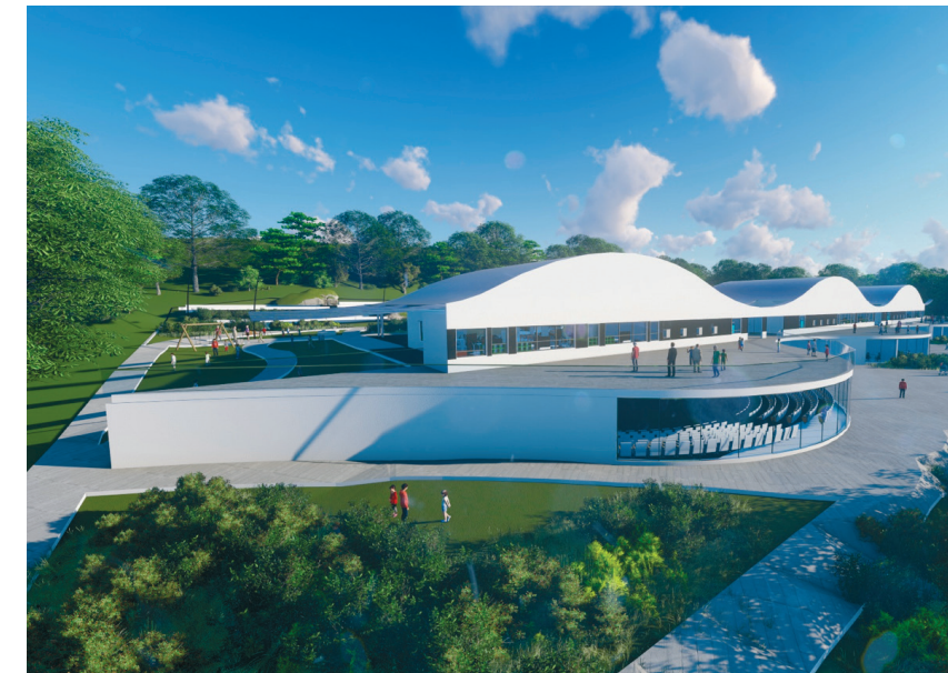
מבט מכר הכניסה לביהס ולאודיטוריום