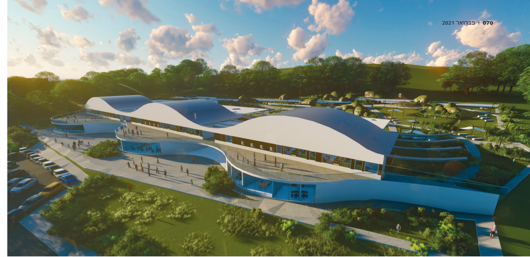
מבט מדרום - אודיטוריום ומרחבי הלמידה