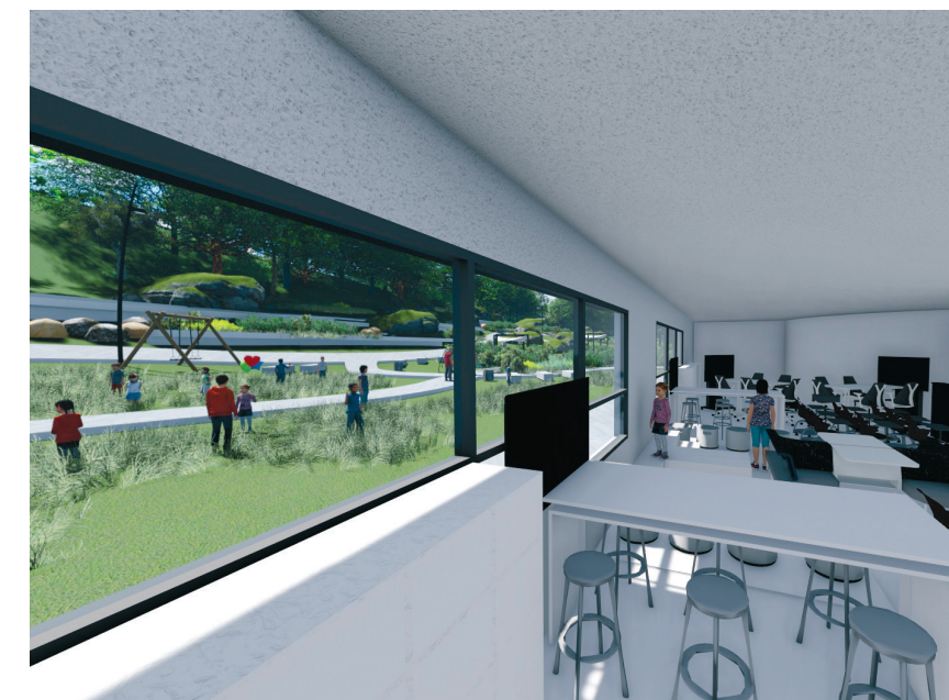
מבט ממרחבי למידה לחצרות צמודות